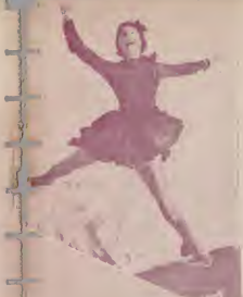
美的靜之子女方東

歐美女子素 好運動，滑 冰尤為盛行 ，左圖為美 國女子短裙 露鞋，正歡 躍於冰上。